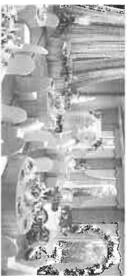
▲年間120組の披露宴目標

ホテルオーケストラグループのオーケストラホテルつくば(茨城県つくば市)は2月、披露宴会場「Naturally(ナチュラルリー)」をリニューアルする。同ホテルは、4月1日に現在の本館を「ホテル日航つくば」に、別館のエポカホテル館を「ホテルJALシテイつくば」にするリブライ